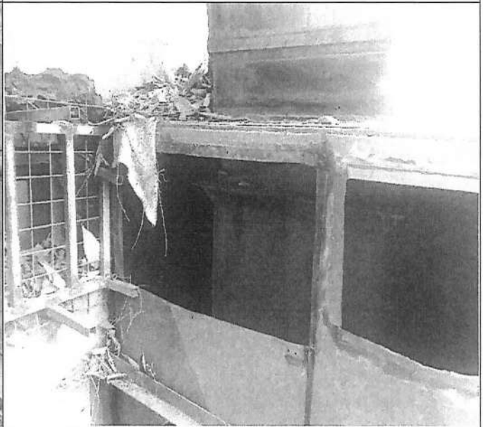
Intervención en muros estructurales