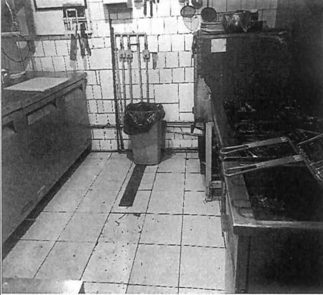
Instalaciones de gas y desagüe sin certificados en permiso de obra menor.