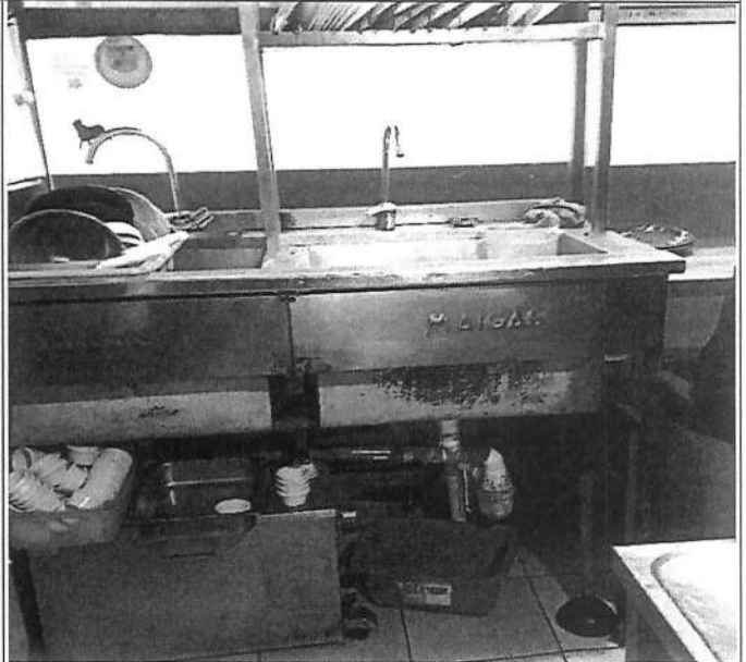
Instalaciones sin no registradas en planos de venta de pisos.