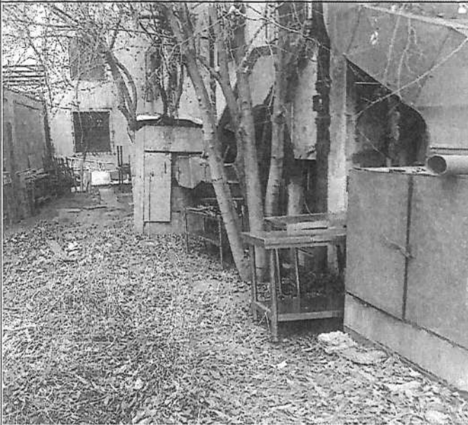
Ocupación con construcciones sin permisos de comité ni municipales.