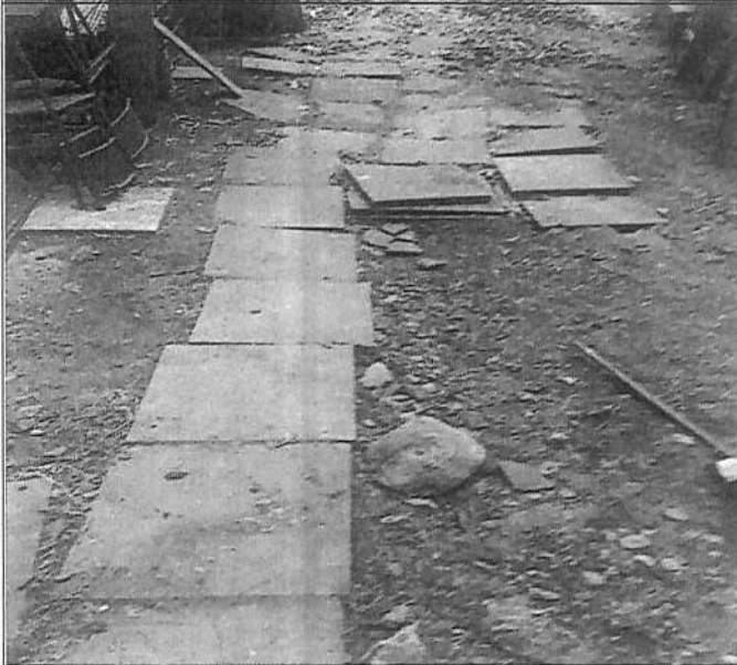
Deterioro de espacios comunes de copropiedad en sector de alcantarillado fuera de local.